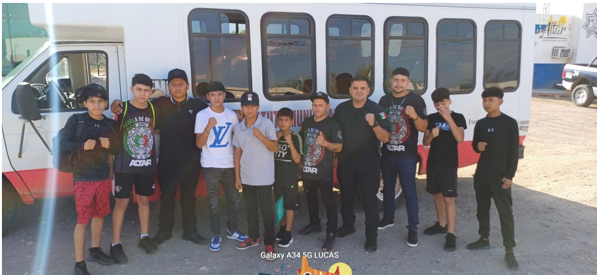
Galaxy A34 5G LUCAS

Otra de las actividades que se brindan, con resultados positivos dentro de Seguridad Pública, es en trabajo que se hace con el Escuadrón Juvenil Deportivo “Heptatlón”, donde realizan diferentes actividades físicas y disciplinarias como la instrucción de orden cerrado, defensa personal, acondicionamiento físico, primeros auxilios, actividades recreativas, juegos, competencias en equipo y brindan apoyo en los eventos cívicos, culturales que realiza el Ayuntamiento.