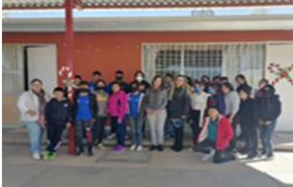
Tipos y modalidades de la violencia en telesecundaria del Ejido Llano Blanco.