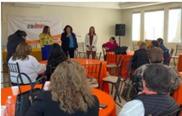
Platica de Prevención del Cáncer de Mama en Escuela Primaria Altamirano 2 el 19 de octubre 2022.