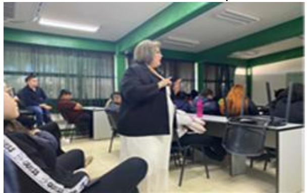
Platica de Violencia en el Noviazgo impartida en CBTA.