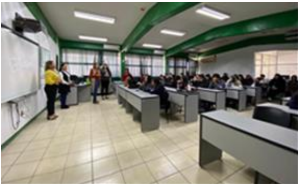
Platica Redes de Apoyo para una Vida Libre de Violencia en la Mujer impartida en CBTA.