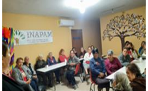
Platica de la Violencia Cultural para adultos mayores e INAPAM.