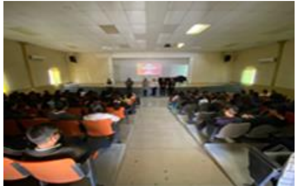
Platicas de Redes de Apoyo para la Violencia en Mujeres en Esc. Sec. Efraín Buenrostro turno Vespertina.