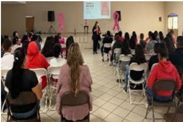
Conferencia “Cosechando Amor” en el arco del día Internacional contra el cáncer de mama en Trincheras Sonora, el día 17 de octubre 2022.

En el área legal se asesoraron a 24 mujeres por primera vez, brindando 15 asesorías subsecuentes para dar seguimiento a los expedientes según la necesidad de las usuarias. Así mismo, en el área psicológica se atendieron a 97 mujeres por primera vez y se brindaron 308 atenciones subsecuentes, con el fin de proporcionarles herramientas y habilidades socioemocionales, para así fortalecer la autoestima, incrementar la seguridad y confianza, además de buscar la sanación emocional y eliminación creencias limitantes y fomentar su empoderamiento, independencia y su crecimiento personal.