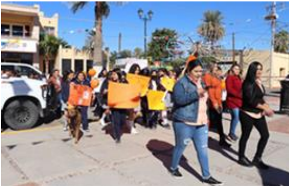
Marcha pacífica por la no violencia contra las mujeres.