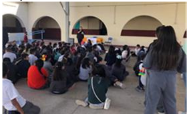
Platica del Vientómetro en Escuela Primaria Ignacio Altamirano 2.