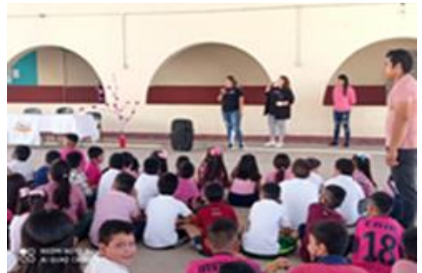
Platica de Prevención del Cáncer de Mama en Escuela Primaria Altamirano No. 2 el día 19 de octubre 2022.