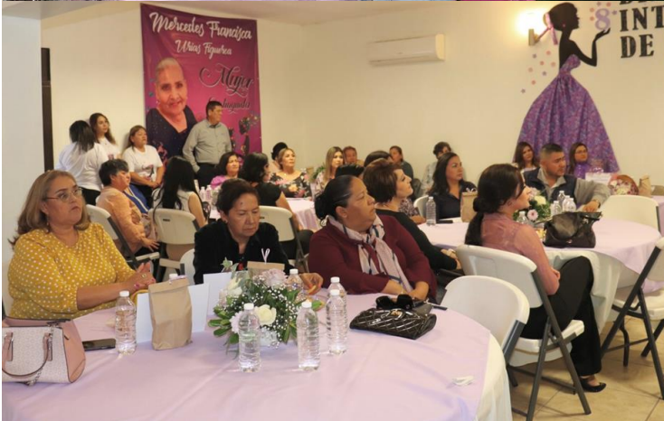
Celebración del Día Internacional Contra el Cáncer de Mama, Día Internacional de la Mujer y Desfile Navideño.